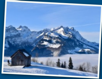
アッペンツェラーランドの冬