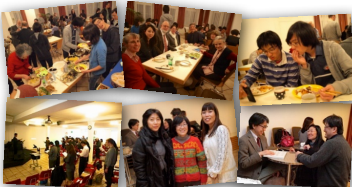
1月13日／27日の礼拝と愛餐会スナップ

5、第20回・スイス日本語福音キリスト教会の総会が、1月27日（日）13時から14時45分までクリショナ教会の本会堂で開かれました。決算／予算報告、活動報告、本年度の活動計画などが承