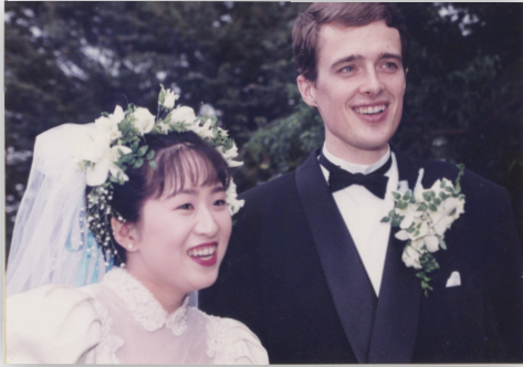
京都平安教会での結婚式

もちろん、そんな馬鹿げた考え方は失敗に終わるしかありません。化学は大変素晴らしいもので、優れた研究者が数多くおられますが、生き物の全てが「分かる」までには果てしない道のりがあります。