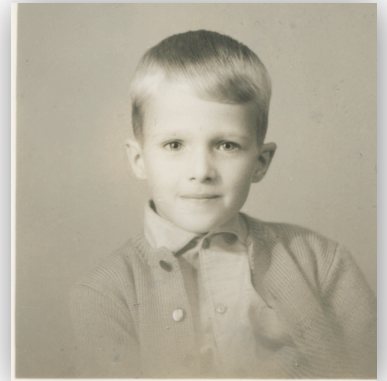
10歳の時。デンマークに来たばかりの頃。

今から考えるととても幸せな時でした。小さな殿様みたいにちやほやされて、ひどく甘やかされていたと思います。しかし、小学校3年生の時、突然デンマーク行きが決まり、この夢のような時から目を覚まされ、新しい文化に放り込まれました。デンマークの学校では、私はもう殿様ではなくなりました。私にとっては厳しい現地の学校へ通うことになりました。そこで幼い私は、いつか必ず日本へ戻って、また日本との関係を自ら立て直すと、心に強く決めました。しかし、どうやって日本へ帰れるのかは、分かりませんでした。