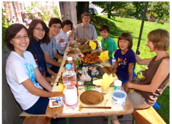
家族とともに遠足。アッペンツェルにて。